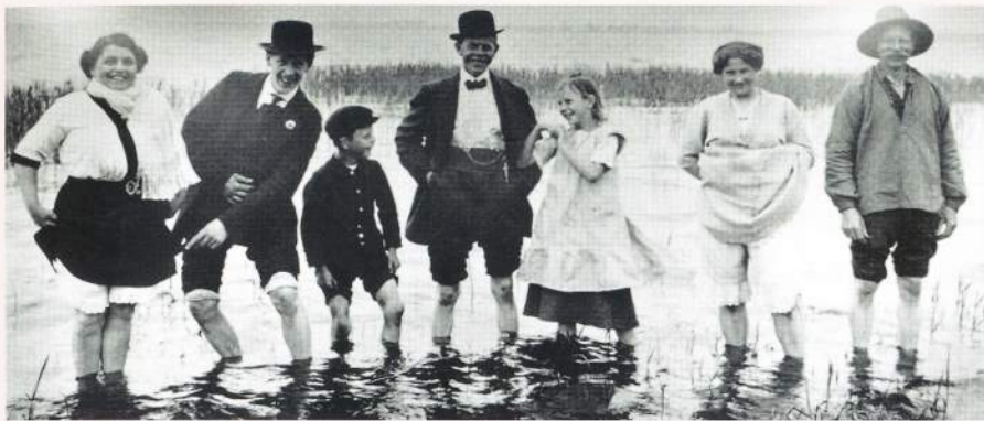
Badeliv i Tissø anno 1914 og 2008. Tissø har været et yndet badested, og badegæster har fra tid til anden bragt nogle af søens hemmeligheder op fra bunden.