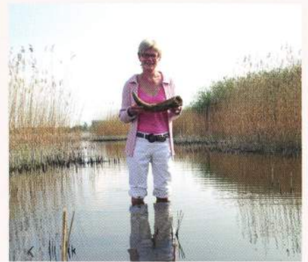
Badelivet gentager sig, om end i mindre målestok, når Tissøs hemmeligheder skal afsløres.

Kongemosekulturen ca. 6.000 f. Kr. eller evt. bronzealderen ca. 1.000 f. Kr. 3