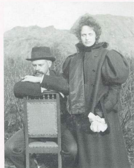
Agnes Henningsen og Carl Ewald i klinerne på Røsnæs